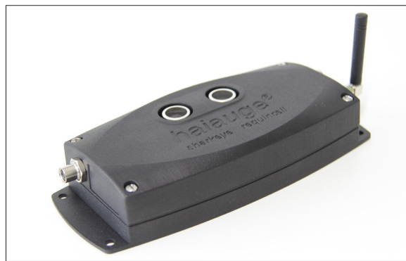
Le Requin-œil mesure et transmet le niveau de remplissage des poubelles.